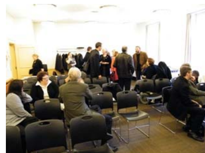
Après le visionnement, les invités discutent ensemble et partagent leurs impressions.