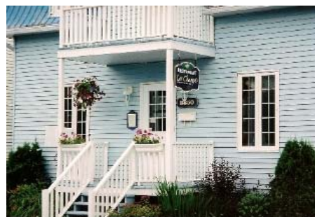
Façade du restaurant