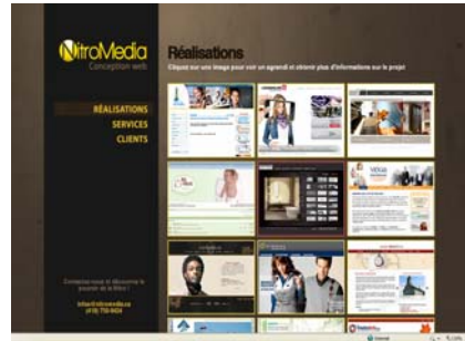
NitroMedia – Conception Web