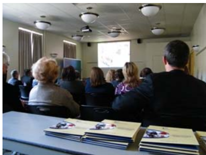
Les invités et collègues visionnant attentivement la vidéo promotionnelle de SPHERE-Québec.