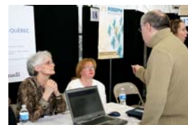
Une écoute attentive

Le 6 mars dernier, SPHERE-Québec a participé à la Journée Contact organisée par le CAMO pour personnes handicapées. Cette Journée a permis à plus de 400 personnes handicapées en recherche d'emploi de rencontrer des employeurs qui avaient des besoins de main-d'œuvre. Bravo au CAMO pour cette heureuse initiative, porteuse de résultats !